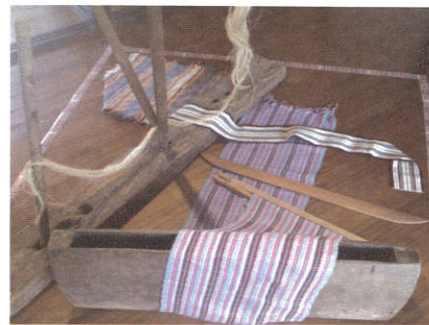
太魯閣族傳統織布器具

太魯閣族女性必須擅長編織技藝，因其具備族群識別的多重意涵，如象徵擅織的成年印記(文面)，代表成為賢妻良母的生活技能，亦是通過彩虹橋審判的條件之一。太魯閣族服飾上的圖騰是幾何式的線條及圖案，以三角形、菱形為主調。