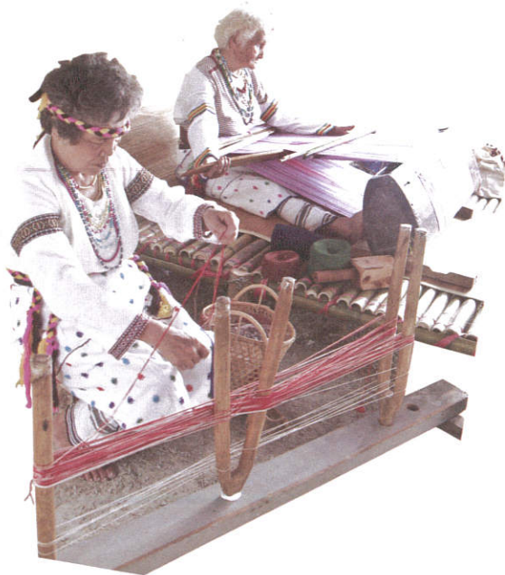
太魯閣族耆老織布