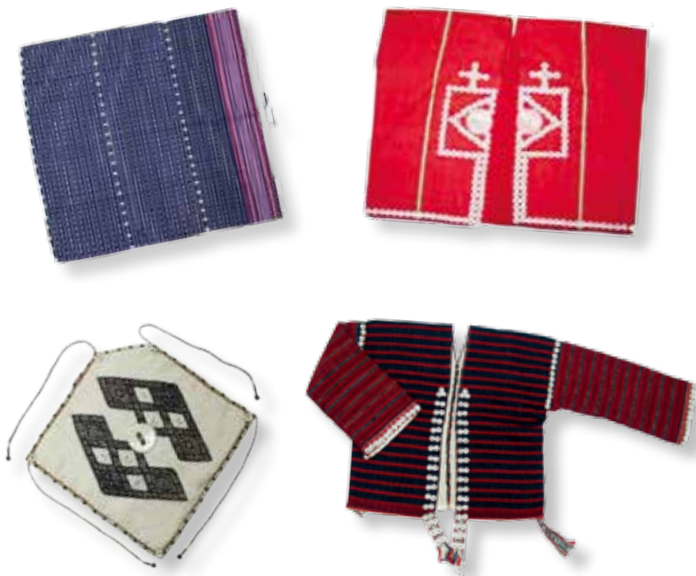
左上 ▶ 屈尺群 XO 紋披肩 右上 ▶ 大料坎群凱旋衣